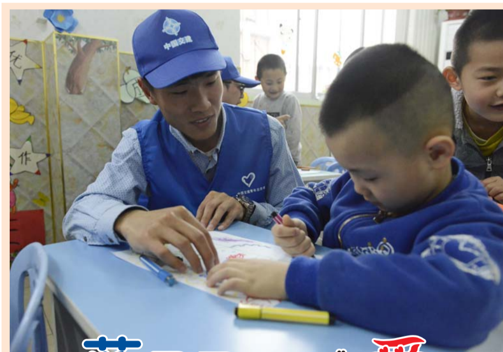
近日,一公司青年职工走进幼儿园,为小朋友赠送智力卡片、绘本等,与小朋友一起作画,描绘心中的春天。