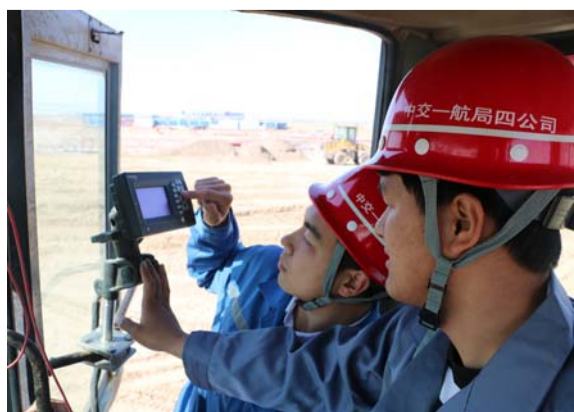
在四公司参建的北京新机场项目中,项目团队积极推行数字化处理施工过程,实时监控,提高了施工过程的实时度,项目高质、高效、安全。