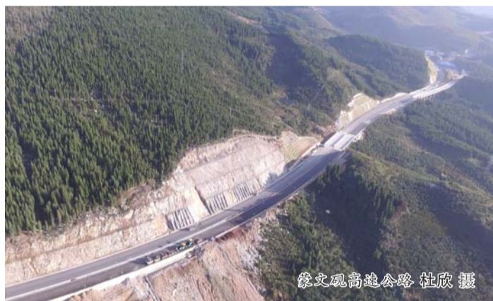
像文观高速公路

其次要解决好如何将分公司做大的问题。从目前的情况看几个分公司主要是在路桥、铁路等新兴领域中生存,而路桥、铁路市场从目前看比传统水工市场的市场容量要大很多。