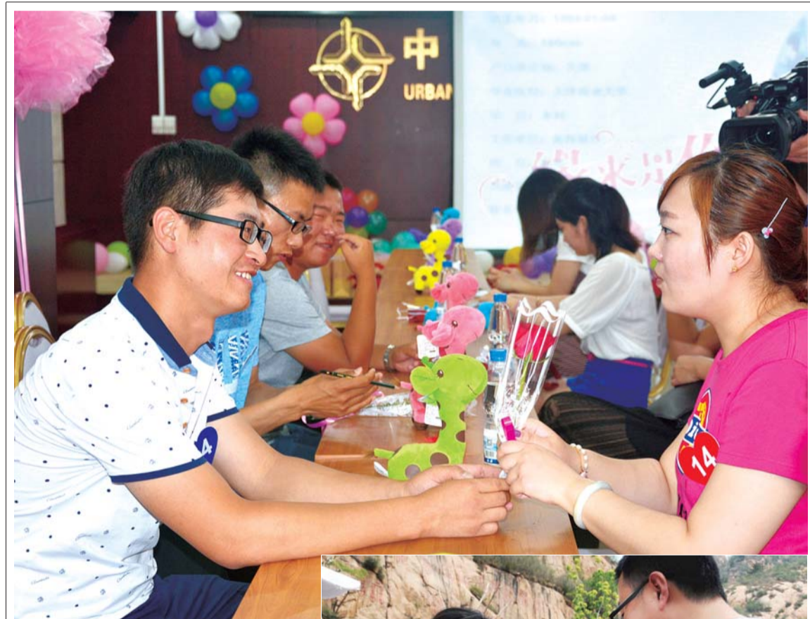
▲7月1日，城交公司举办“相约城交 缘来是你”联谊活动。

职工队伍整体士气和精神风貌进一步提升。基层各单位在规范员工行为、营造宣传氛围、强化文明施工方面的工作力度普遍加强，员工品牌意识、创优意识进一步提升。在大连湾海底隧道项目，公司成功承办开工仪式，得到上级和地方领导好评，展示了员工昂扬向上的面貌。万洋高速项目代表全线承办了项目建设推进会，工程管理工作和员工高昂士气得到海南省交通厅、质监局等单位领导充分肯定。