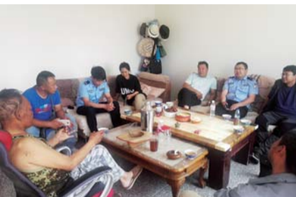
征迁小组沟通化解与牧民间的矛盾