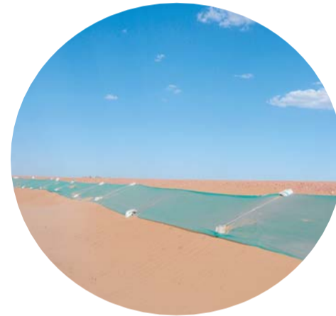
防风固沙

有一件事让彭卫宇记忆犹新：“记得去年 5 月的一天，下了场大雨，风力达到 6-7 级，这是入场后头一次遇到这么大的风和雨，拌和站那几个高高的储料仓没挂缆风绳。当时我离得远没办法过去，心里特着急，赶紧打电话给拌和站，当收到他们拍得挂好缆风绳的照片时，这才踏实下来。从那以后，绳子就没取下来过，因为总有突风，你根本不知道什么时候会来。其实这些绳子是比较碍事的，场站到，罐车、拉料的货车进进出出很容易撞到，所以又在旁边加上了防撞桶。原来没一直挂着也是这个原因。”