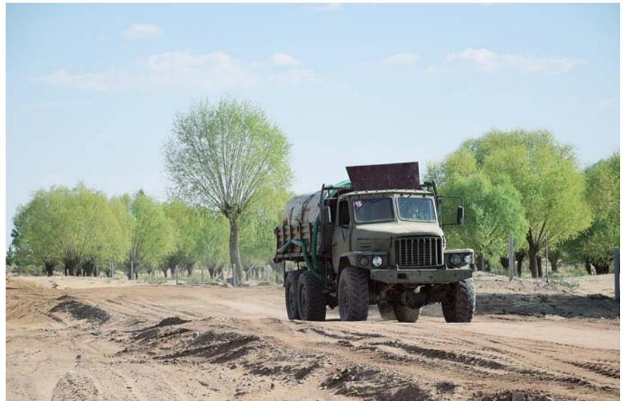
洒水车现场作业，降低施工线路温度的同时抑制了道路灰尘的飘散

“要不是修路，我们说啥也挖不平那集中连片的沙包，让大沙丘变成草地。”牧民朝格图巴亚尔指着自家新地欣喜地说。有了新地，牧民们不仅能种草，还能种植苜蓿等经济作物，增加收入的同时还能涵养水源，保护环境。