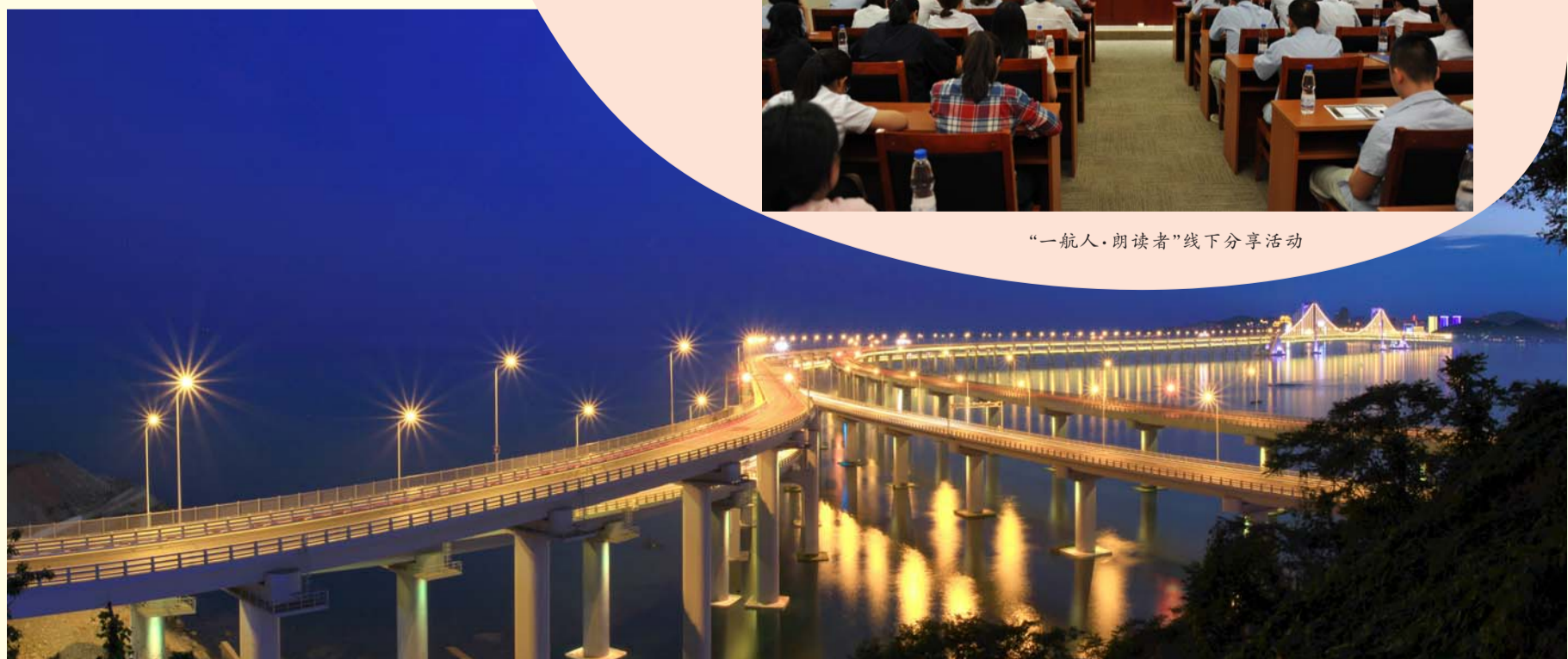
大连南部滨海大道通车