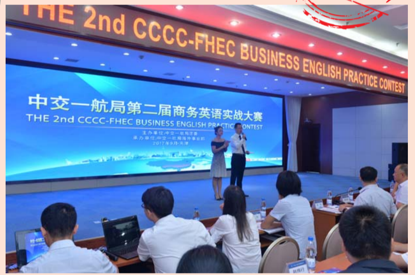
商务英语实战大赛