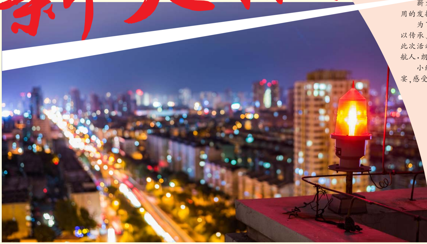
心灯(拍摄地点为五公司红光里家属区楼顶)

小编挑选了文化周的精彩片刻,让我们一起走进这场丰富多彩的文化盛宴,感受筑梦人自己的文化风采。