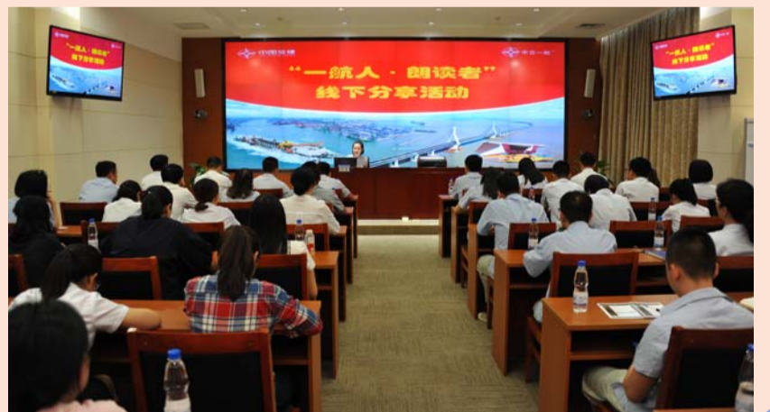
“一航人·朗读者”线下分享活动