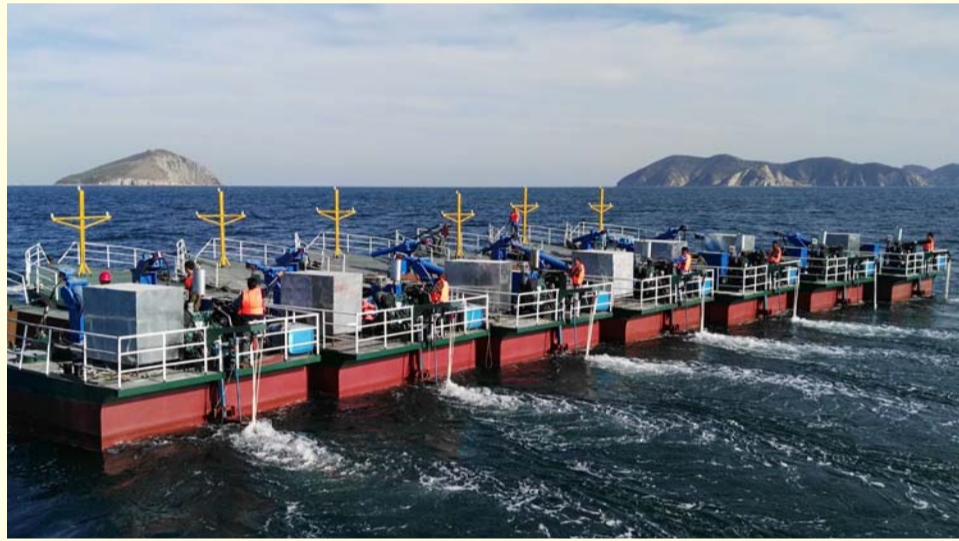
编队前进(为安哥拉项目调运半潜船)