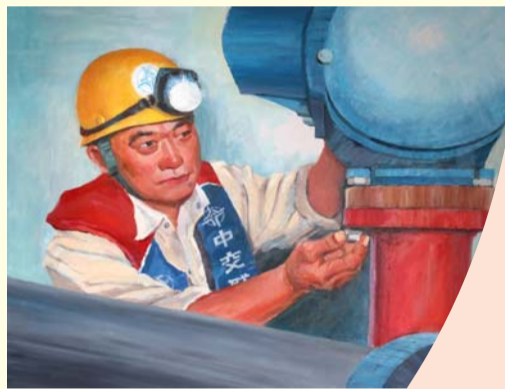
大国工匠管延安 顾新成 绘