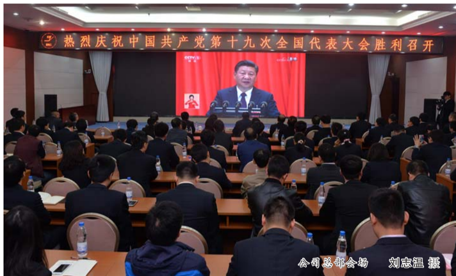
公司总部会场

安装公司总部及所属11个单位同步收看党的十九大开幕会直播,聆听学习习近平总书记代表十八届中央委员会作的重要报告;城交公司的干部职工深受鼓舞,表